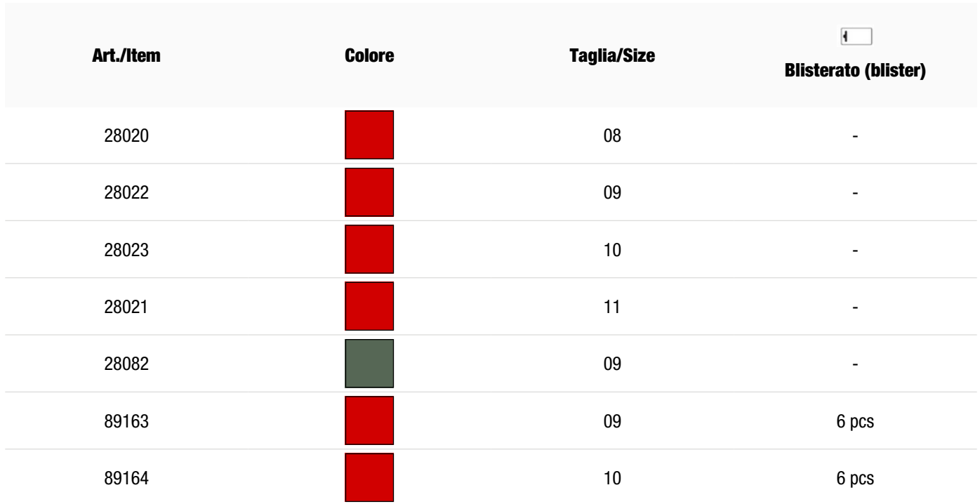
Tabella varianti articolo